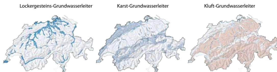
Abbildung 4: Verteilung verschiedener Grundwasserleiter in der Schweiz. 16

Diese Veränderungen bei der Grundwasserneubildung haben zur Folge, dass die Quellschüttungen bei oberflächennahen Quellen mit kleinem Einzugsgebiet und bei Karst-Grundwasserleitern saisonal stärker schwanken werden und im Sommer und Herbst zum Teil versiegen können. In Grundwasservorkommen in Talschottern mit mittelländischem Fliessregime ist zu erwarten, dass die Grundwasserstände im Sommer und Herbst sinken. Grundwasservorkommen in Talschottern mit alpinem Fliessregime, die im Sommer ihren saisonalen Höchststand aufweisen, werden nur leicht sinkende Wasserstände verzeichnen. Allerdings muss wohl auch hier während den öfters vorkommenden Hitzesommern und der fehlenden Gletschereisschmelze im Spätsommer und Herbst mit tieferen Grundwasserständen gerechnet werden. In tieferen Grundwasserleitern wird ebenfalls ein leichter Rückgang der Grundwasserstände erwartet.