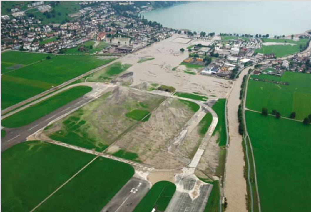
Abbildung 3: Im August 2005 wurde das Hochwasser der Engelberger Aa um das schadenempfindliche Siedlungsgebiet geleitet.

Um bei einem ausserordentlich grossen Hochwasser den Schaden auf ein erträgliches Mass zu begrenzen, werden die überschüssigen Wassermassen auf wenig schadenempfindliche Flächen umgeleitet. Beim Hochwasser vom August 2005 kam diese Notfallmassnahme zur Anwendung. 25–50% des Hochwasserabflusses wurde auf Sportplätze, Landwirtschaftsflächen, Parkplätze und andere wenig schadenempfindliche Flächen um das Siedlungsgebiet geleitet. Diese Massnahmen müssen baulich und raumplanerisch vorbereitet werden.