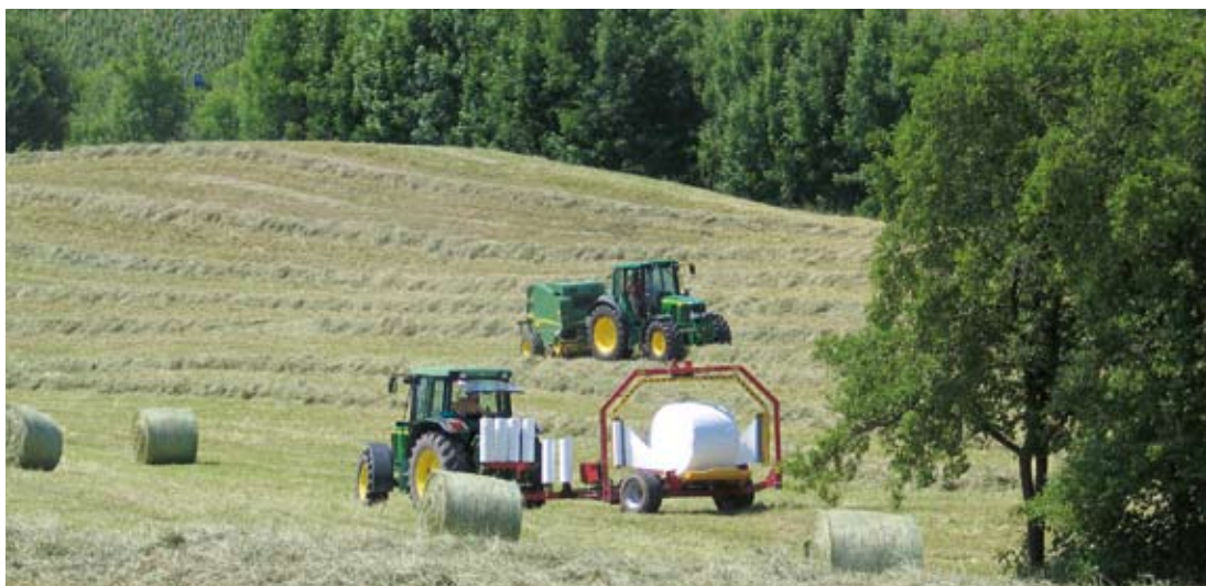
Abbildung 5: Bei der Ernte von Rundballensilage ergeben sich aufgrund der Klimaerwärmung zusätzliche Erntemöglichkeiten im Früh- und Spätsommer. Teure Spezialmaschinen können so besser ausgelastet werden.

Besonders nützlich wäre es für die Praxis, wenn bei der Jahresplanung eine saisonale Vorhersage vorliegen würde. Damit würde die Betriebsführung unterstützt, die für den Fall eines stärker von Extremen geprägten Klimas eine breite Massnahmenpalette zur Hand haben muss.