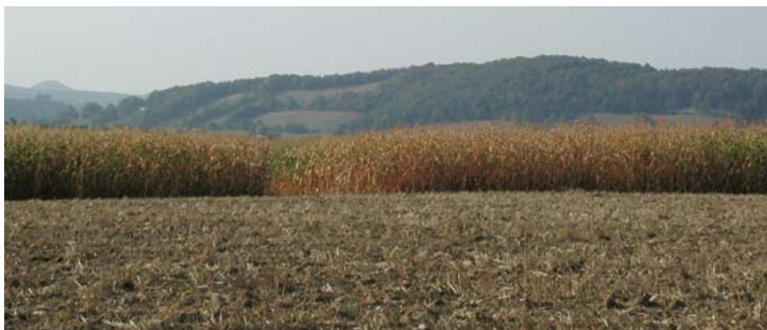
Abbildung 2: Maisfeld mit Trockenschäden 2003.

Angesichts der dargestellten Entwicklung stellt sich zunehmend die Frage nach der Versicherungsdeckung von Schäden auch im Acker- und Futterbau und nach der Finanzierung der Schadensbehebung infolge von Extremniederschlägen, Hagel und Dürre. Offen ist die Frage der damit verbundenen Kosten für die Landwirtschaft selbst oder die Finanzierung aus staatlichen und anderen Quellen.