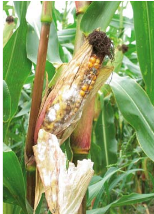
Abbildung 4: Befall eines Maiskolbens durch toxische Fusarium-Pilze. Das Auftreten der Fusarien wird durch Verletzungen des Maises durch Insekten, Hagel und Wachstumsrisse verursacht. Es wird durch stark wechselnde Klimabedingungen gefördert.

Das Auftreten von pilzlichen und bakteriellen Krankheitserregern ist stark klima- und witterungsabhängig. Je nach Wirt-Pathogen-System wird sich die Klimaänderung auf die Populationen positiv, negativ oder neutral auswirken. 19 Milde Winter und Frühjahre sind förderlich für Braun- und Gelbrost, Mehltau und Helminthosporium-Blattfleckenkrankheiten von Getreide und Mais. Warme und eher trockene Sommer dürften hingegen zu einem Rückgang von feuchteliebenden Krankheiten wie der Spelzenbräunekrankheit und von Ährenfusariosen bei Weizen führen. Auch Epidemien der Kraut- und Knollenfäule der Kartoffel würden dabei gebremst, aber wegen einem früheren Beginn insgesamt möglicherweise nicht geschwächt. Beim Mais dürften durch zunehmende Frassschäden (Maiszünsler) und wetterbedingte mechanische Verletzungen der Pflanzen (Hagel, Sturm) toxinbildende Fusarium-Pilze verstärkt auftreten (siehe Abb. 4). Zudem können als Folge der steigenden Ozon-Konzentration fakultative Parasiten, die für ihre Vermehrung nicht auf den Wirt angewiesen sind und nur zeitweise dort gefunden werden, vermehrt Schaden an Kulturpflanzen anrichten. 6